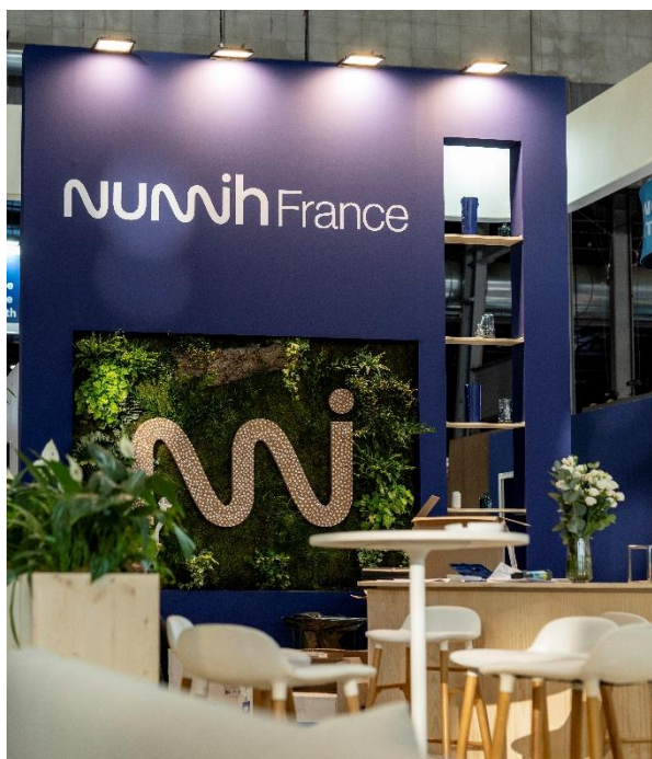
Espace démo type salon :