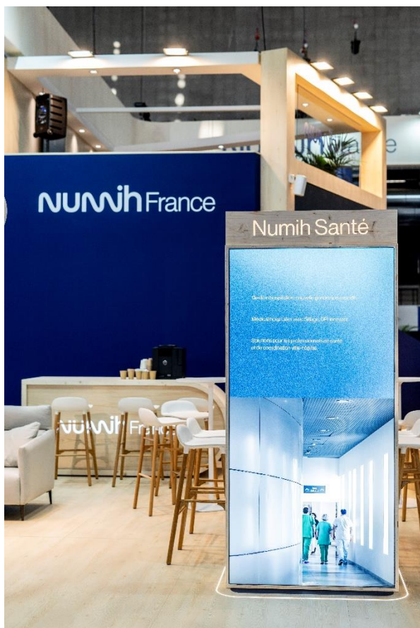
Salon fermé :